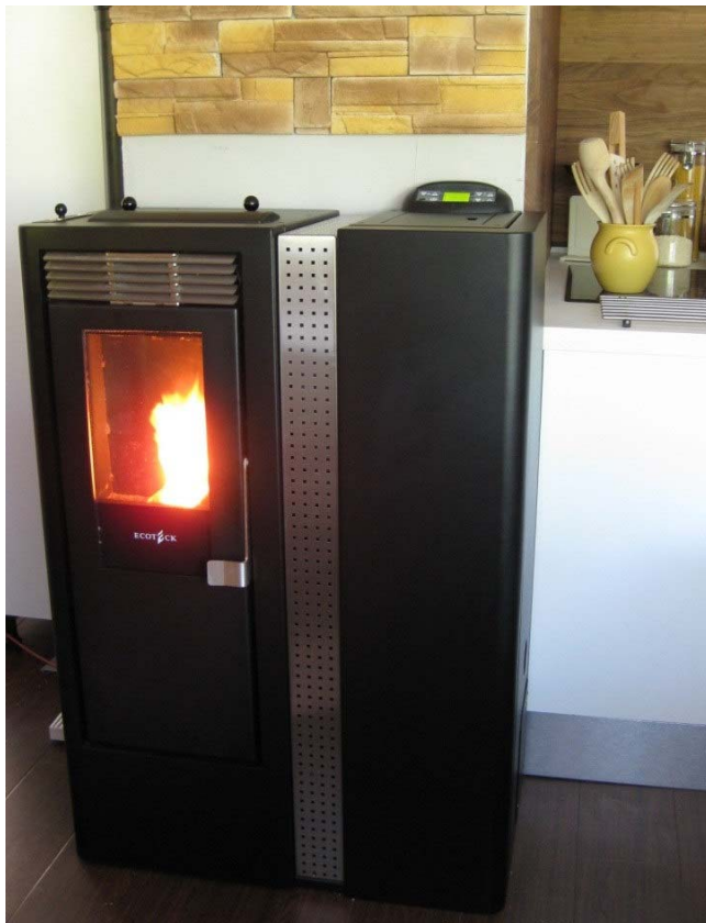
Snella, asennettuna / installerad