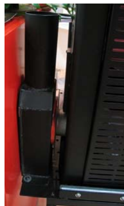
Savuputkiliitântä / Rökrörsanslutning

Kompakt och effektiv. Den här kaminen tillför rummet värme och stil, samtidigt som den håller liv i traditionen för eldstaden. Det här är den bästa ersättaren till den klassiska vedeldstaden.