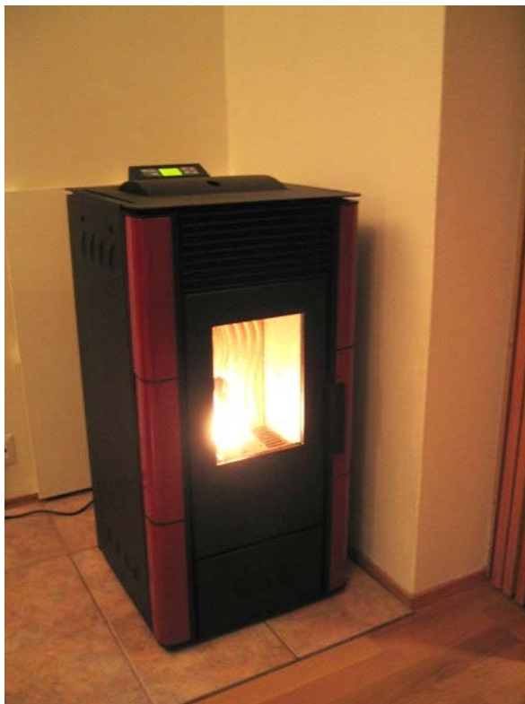
Lisa, Sipoo / Sibbo

Med dess kompakta storlek och alla fördelar med Ecoteck-kaminernas höga prestanda, är Lisa idealisk för uppvärmning av små rum.